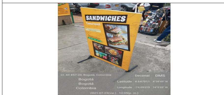
Foto del establecimiento donde se identifica un aviso en espacio publico.